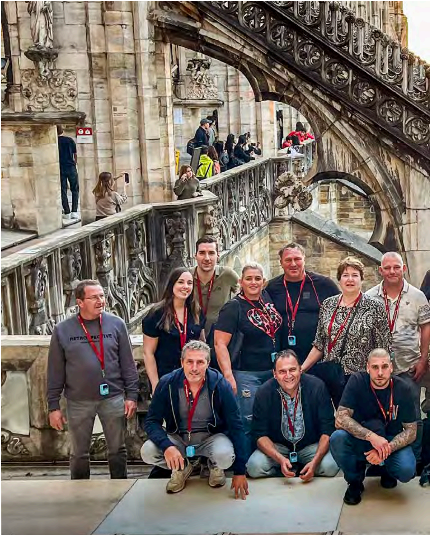
Ter gelegenheid van het zestigjarig bestaan van Hendrixx Daksystemen werd het voltallige personeel begin november getrakteerd op een reis naar Milaan. Het werd een heel gezellig en geslaagd weekend! Deze groepsfoto is gemaakt bij de Duomo.